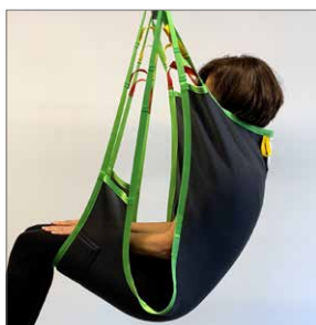
Comfort Sling Soft Art. Nr: 25064

Onze Comfort Slings zijn zachte tilbanden zonder aanpassingen of handgrepen die zich gemakkelijk vormt naar het lichaam van de cliënt. De tilband is ontworpen om de patient een comfortabel en veilig gevoel te geven. De tilband is een verblijfsband zonder beenslips, die het gewicht gelijkmatig verdeelt om de druk te verminderen.