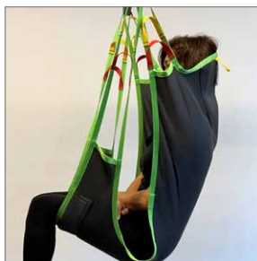
Comfort Sling Soft High Art. Nr: 25069