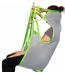
Silhouette Sling Polyester Net Art. Nr. 25015

De Silhouette tilband is een comfortabele tilband zonder baleinen, handvatten of verstevigingen. De tilband vormt zich naar de patiënt en biedt goede ondersteuning voor het hele lichaam. De tilband kan in de meeste til-situaties worden gebruikt, maar is vooral geschikt voor transfers naar rolstoelen, gevormde stoelen of speciale zittingen.