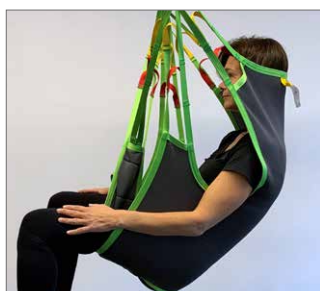
Silhouette Sling Soft Art. Nr. 25019